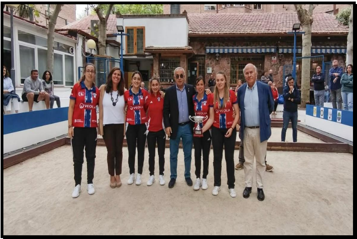
Subcampeonas: P.B Atlético Deva