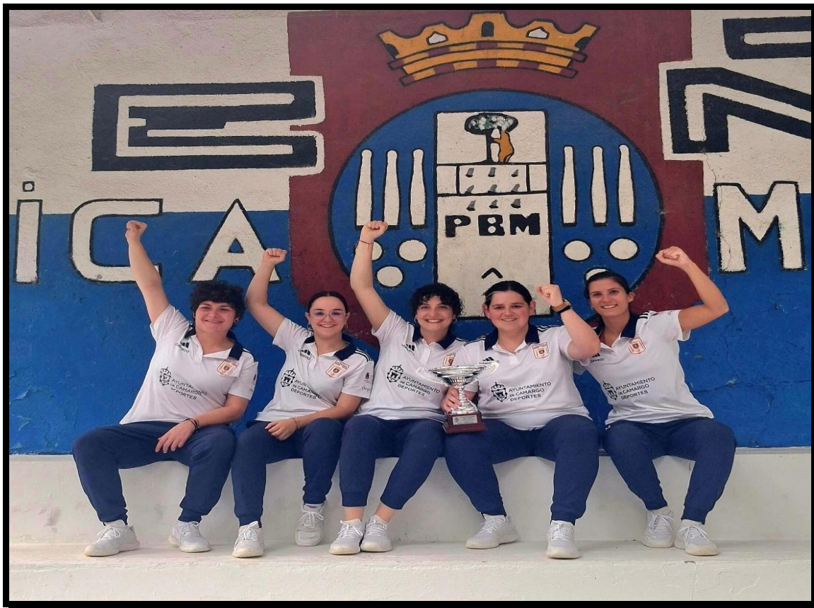
Campeonas IV Copa Federación Española Femenina de Bolo Palma - P.B Camargo