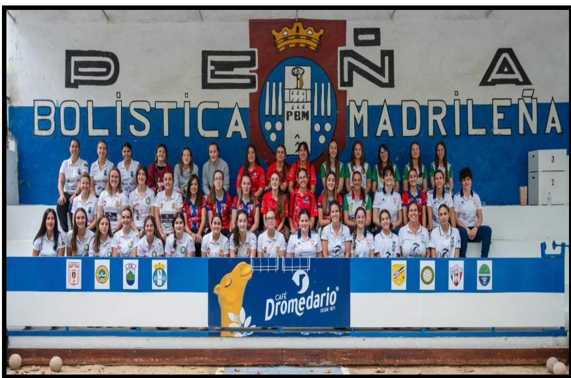
Todas las jugadoras participantes en la IV Copa Federación Española de Bolo Palma