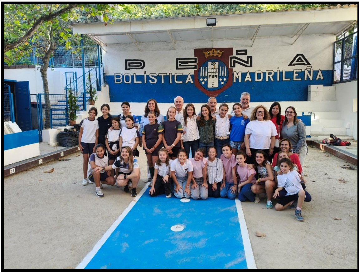
Taller de Bolo Palma. Participantes, docentes, federativos y directivos.