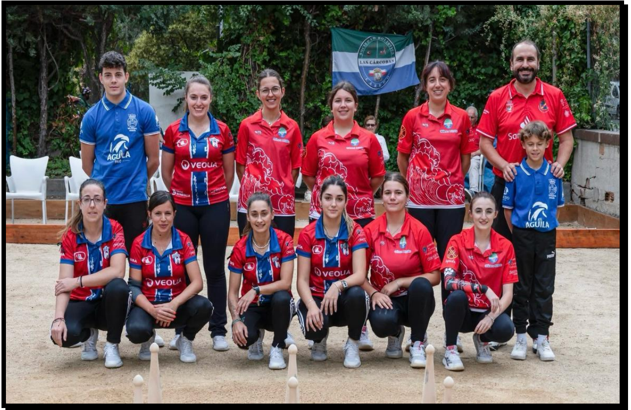
Cuartos: PB Atlético Deva – P.B Las Carcobas