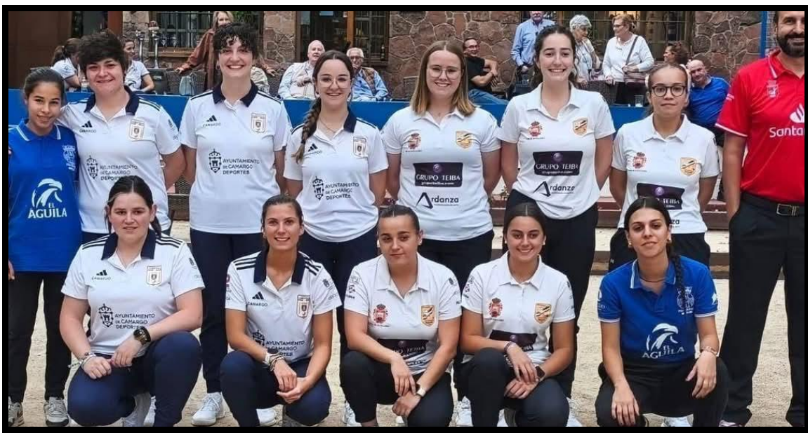
Cuartos de final: P.B Camargo – P.B Los Remedios