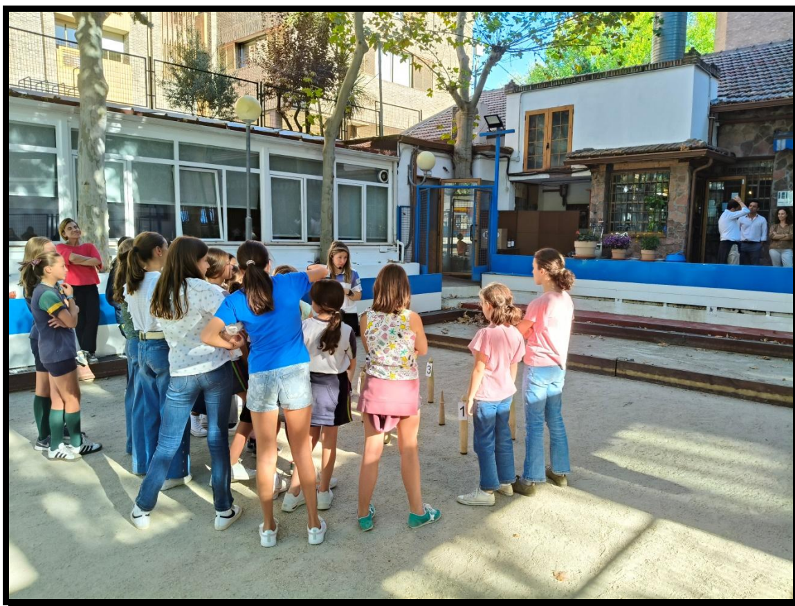
Taller de Bolo Palma