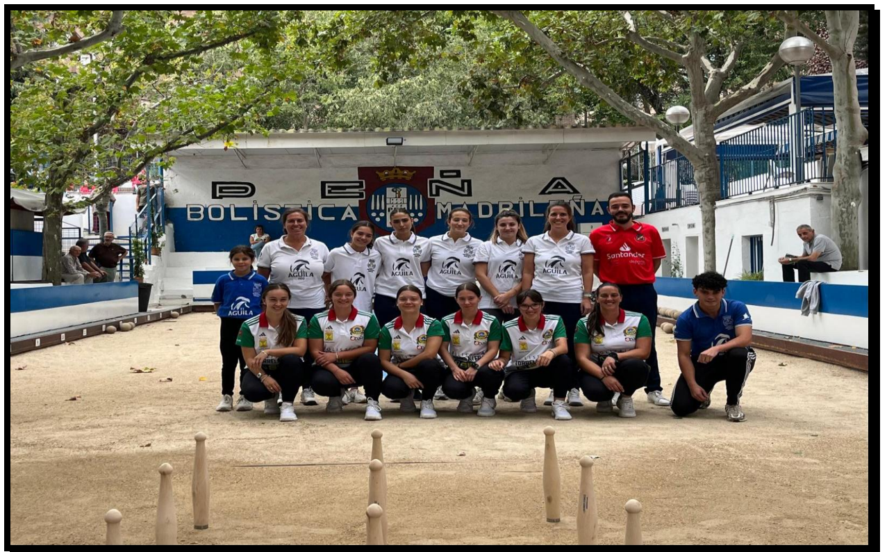
Cuartos: P.B Torrelavega – P.B Madrileña