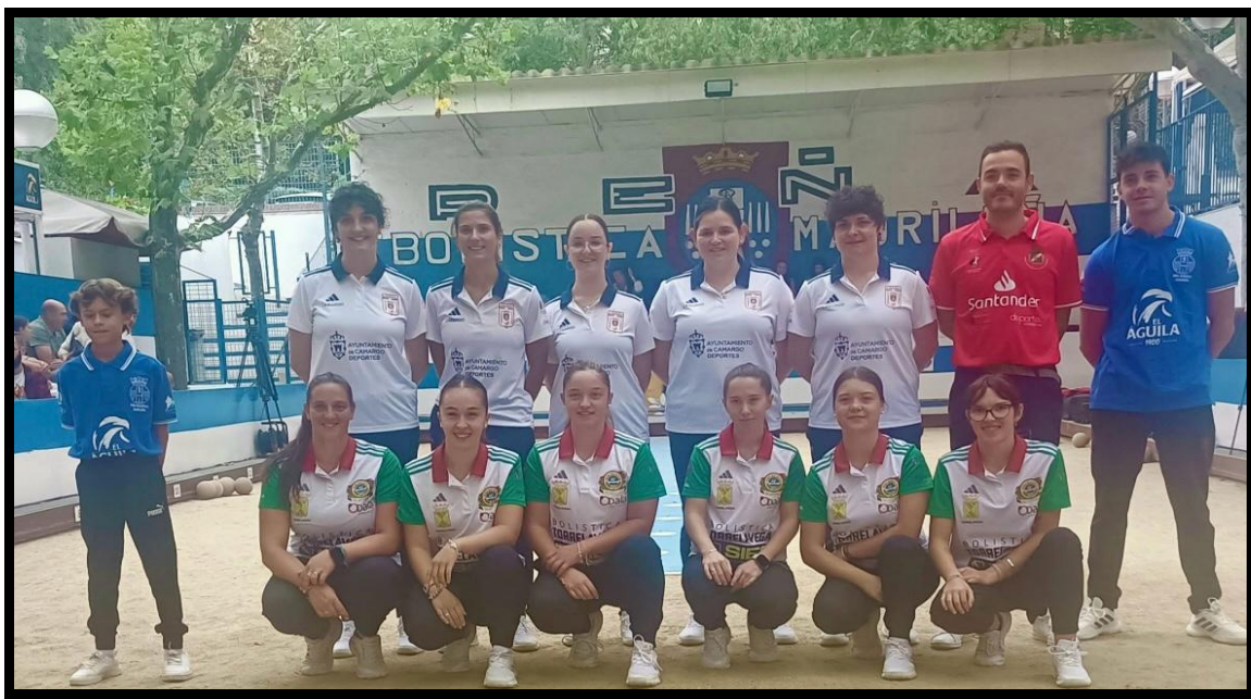
Semifinal: P.B Camargo – P.B Torrelavega