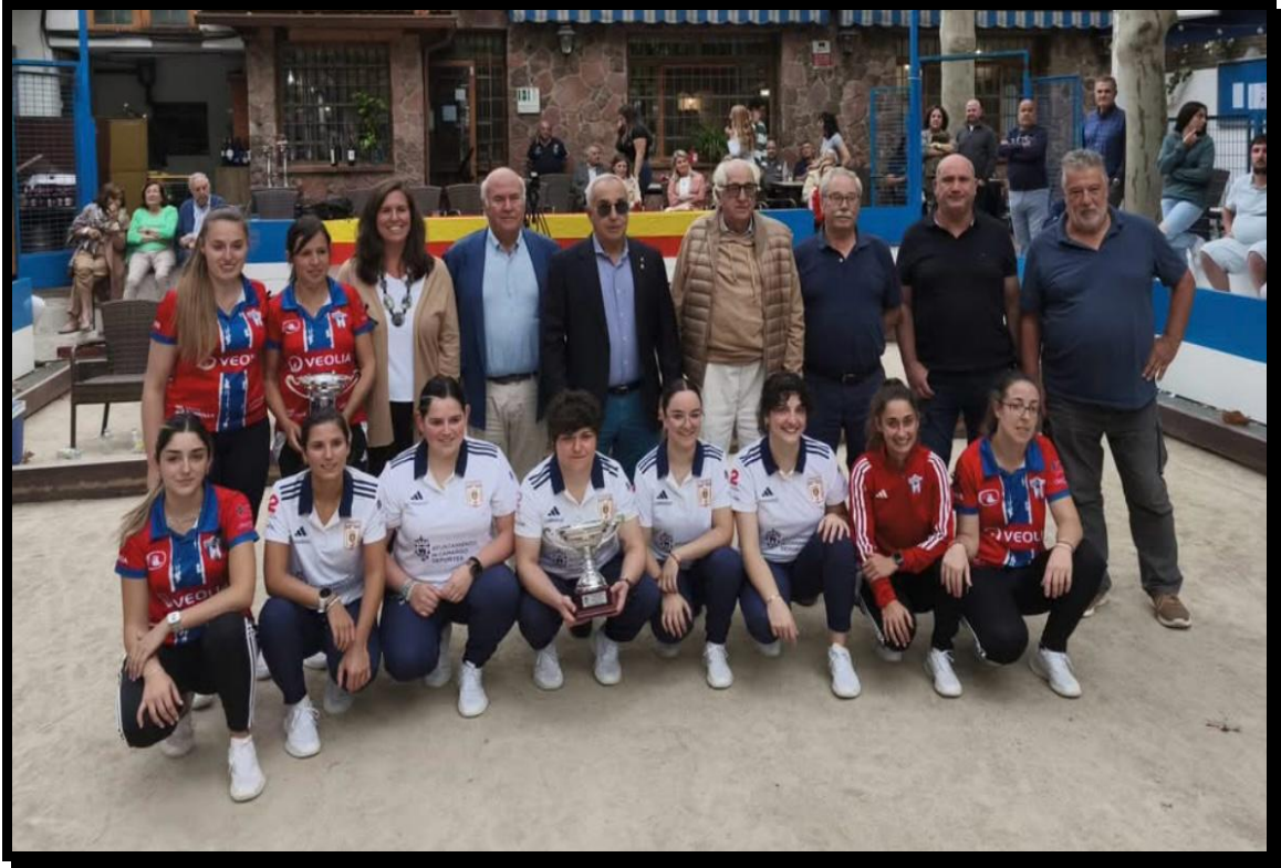
Entrega de premios. Campeonas, subcampeonas y autoridades