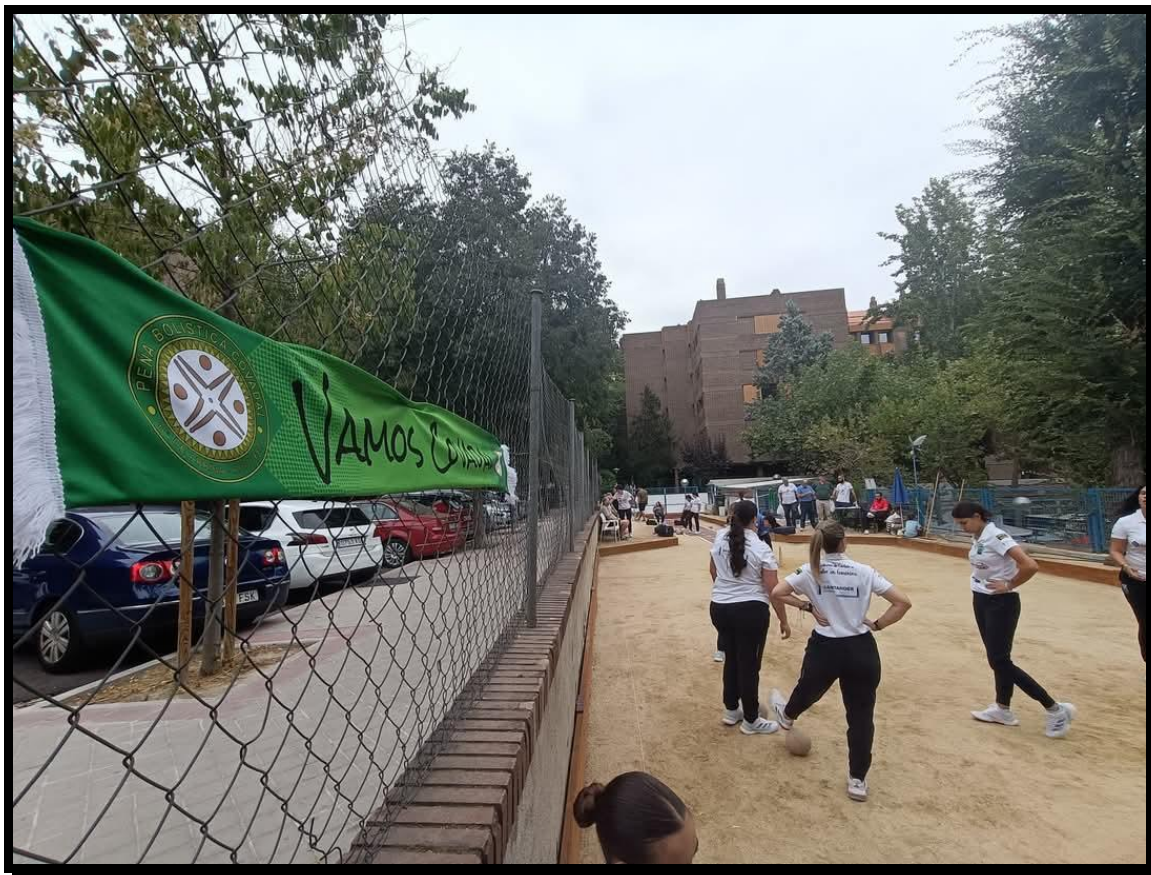
Cuartos: P.B Peñacastillo – P.B Covadal